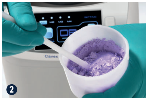
2 Roer kort voor om de mengbeker makkelijker te kunnen reinigen en ter behoud van de mixer.