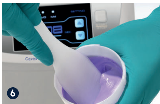
6 Haal de algiinaat mix in één beweging uit de mengbeker en breng het aan in de afdrucklepel.