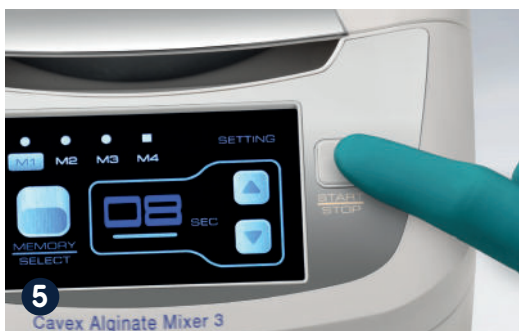
5 Kies het programma, druk op start en wacht tot het programma is afgerond.