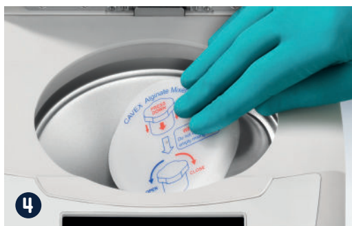
4 Plaats de mengbeker in de mixer en sluit het deksel.