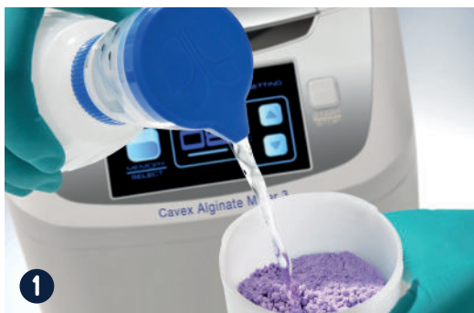
1 Doe de juiste dosering algiinaat en water in de mengbeker.